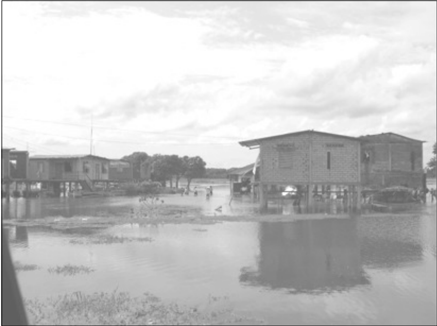
Palafitos rodeados de agua durante las inundaciones en Cantón Baba, Provincia de Los Ríos. 1998.

tos se levantaban sobre palafitos o en construcciones de dos alturas, y se reservaba siempre la más alta a la vivienda familiar, que queda de este modo a salvo de las crecidas 44 .